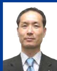
北見商工会議所青年部 会長