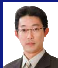
北見商工会議所青年部

第1研修委員会・第2研修委員会・親睦委員会・総務広報委員会が正副委員長リーダーシップにより、記憶に残る事